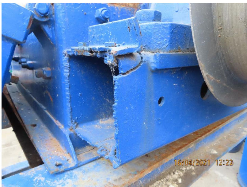
Slika 12-lom same šasije dijela postrojenja