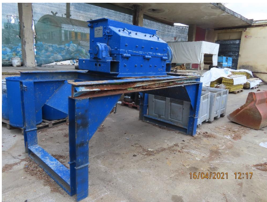
Slika 1: pogled sprijeda